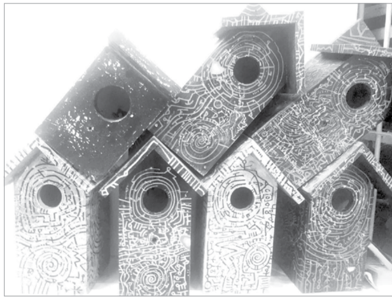
«Волшебные» скворечники от Валериуса