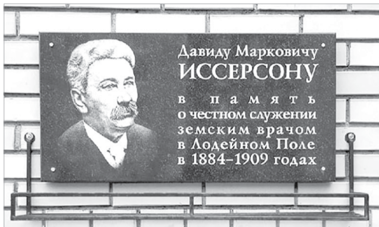
Мемориальная доска на здании городской поликлиники