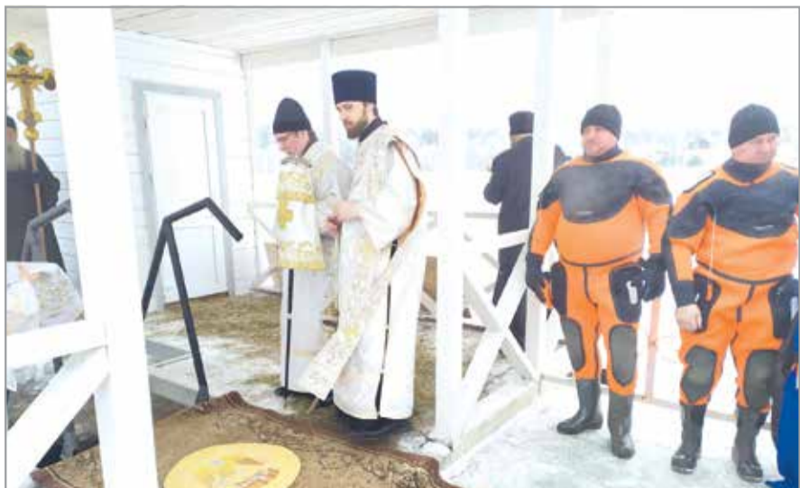
Спасатели обеспечивают безопасность во время Крещенских купаний

В 2021 ГОДУ ОТРЯДОМ ПРОВЕДЕНО 156 ПОИСКОВО-СПАСАТЕЛЬНЫХ ОПЕРАЦИЙ, ВО ВРЕМЯ КОТОРЫХ СПАСЕНО 120 ЧЕЛОВЕК. НА ДТП ВЫЕЗЖАЛИ 20 РАЗ, НА ПОИСКИ ПРОПАВШИХ В ЛЕСУ – 61, СПАСЕНИЕ ЛЮДЕЙ НА ВОДОЁМАХ ПРОВОДИЛИ 28 РАЗ.