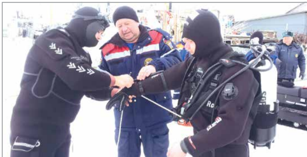
В отряде 8 спасателей имеют специальность водолаза