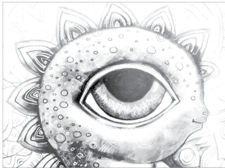
Таким художник видит талисман счастья